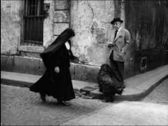
Robert Doisneau, Les frères, Paris 1936

„Je vous salue ma rue...” avec Jacques Prévert.