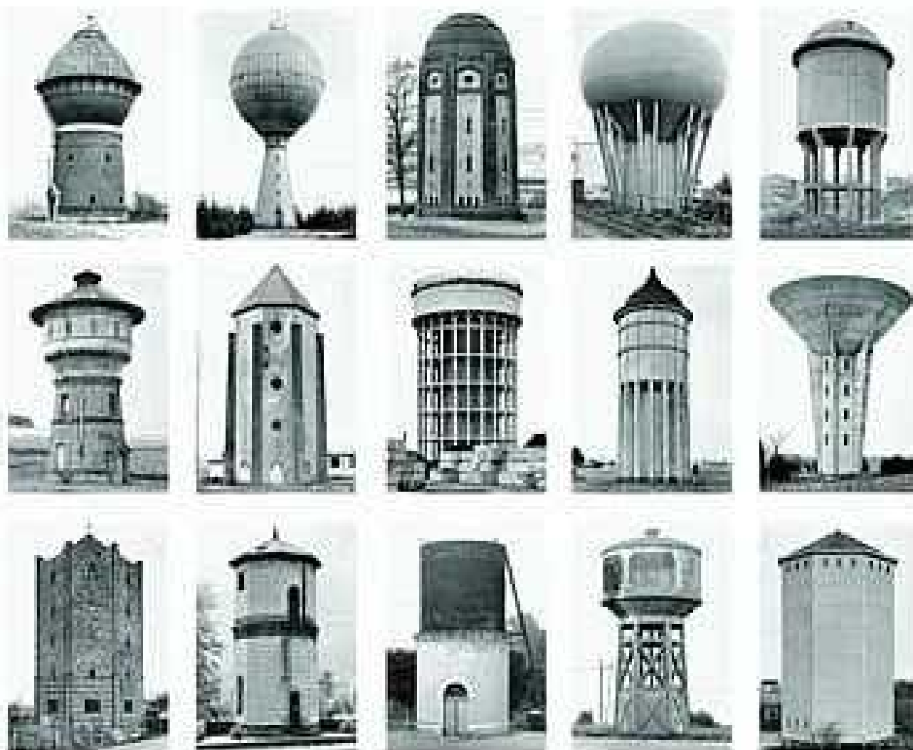
Châteaux d'eau photographiés dans les années 60