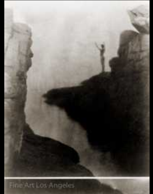
Fred Holland Day