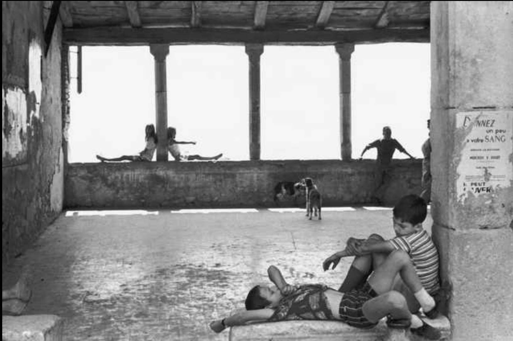
„l'instant décisif“ de Cartier Bresson

Composition parfaite, cadrage parfait, Cartier Bresson ne recadrerait jamais ses tirages