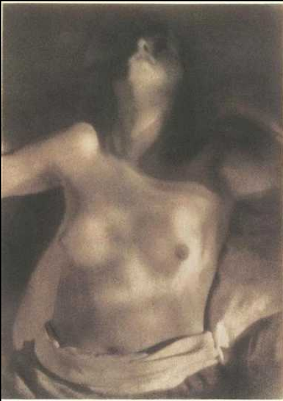
Heinrich Kühn, 1920.