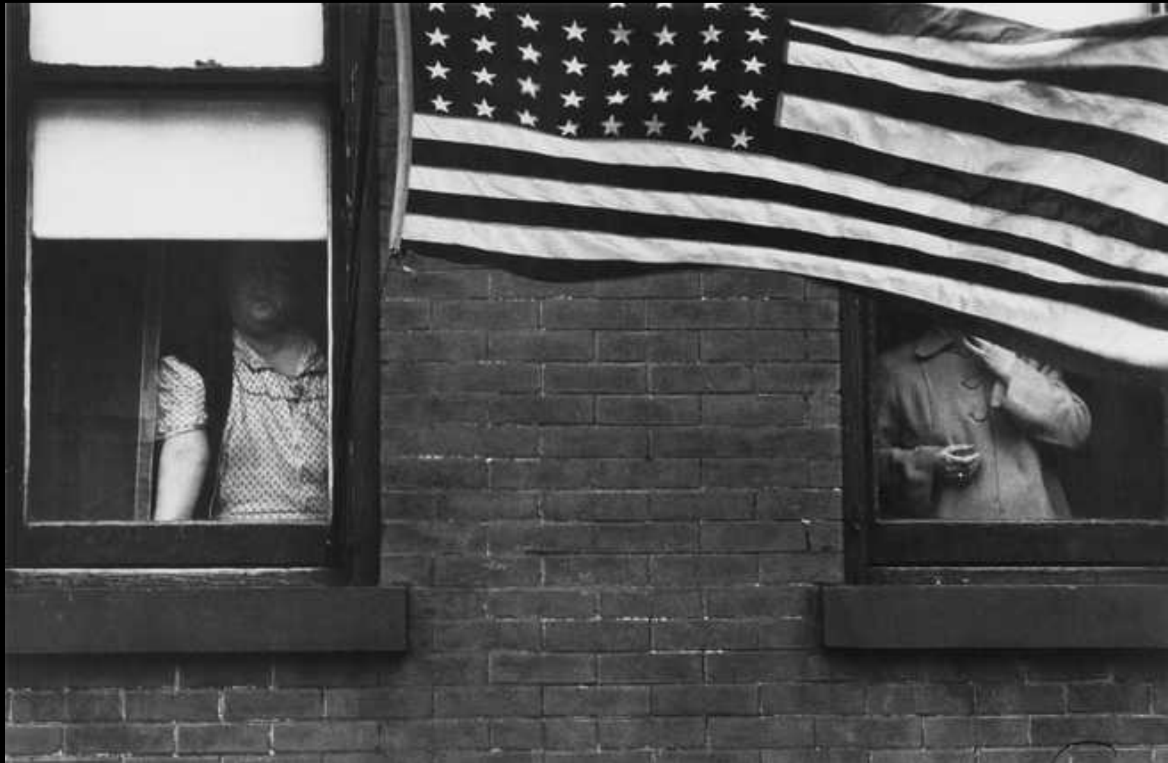
Les années 50' Robert Franck „Les Américains“.