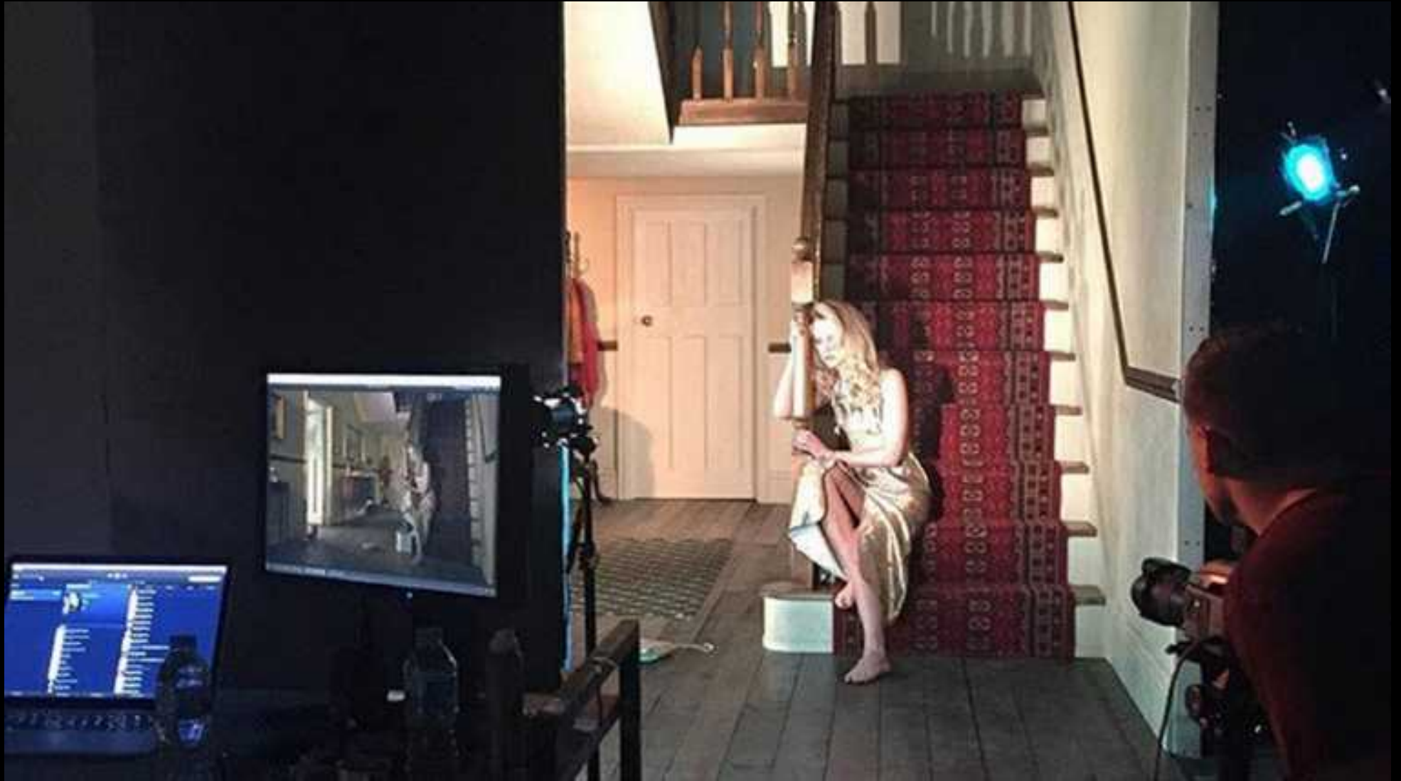
Le making off de la photo précédente