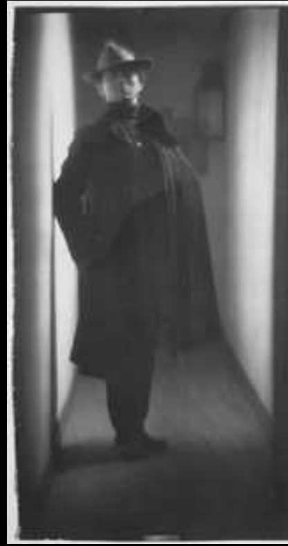
Edward Steichen par Fred Holland day 1901