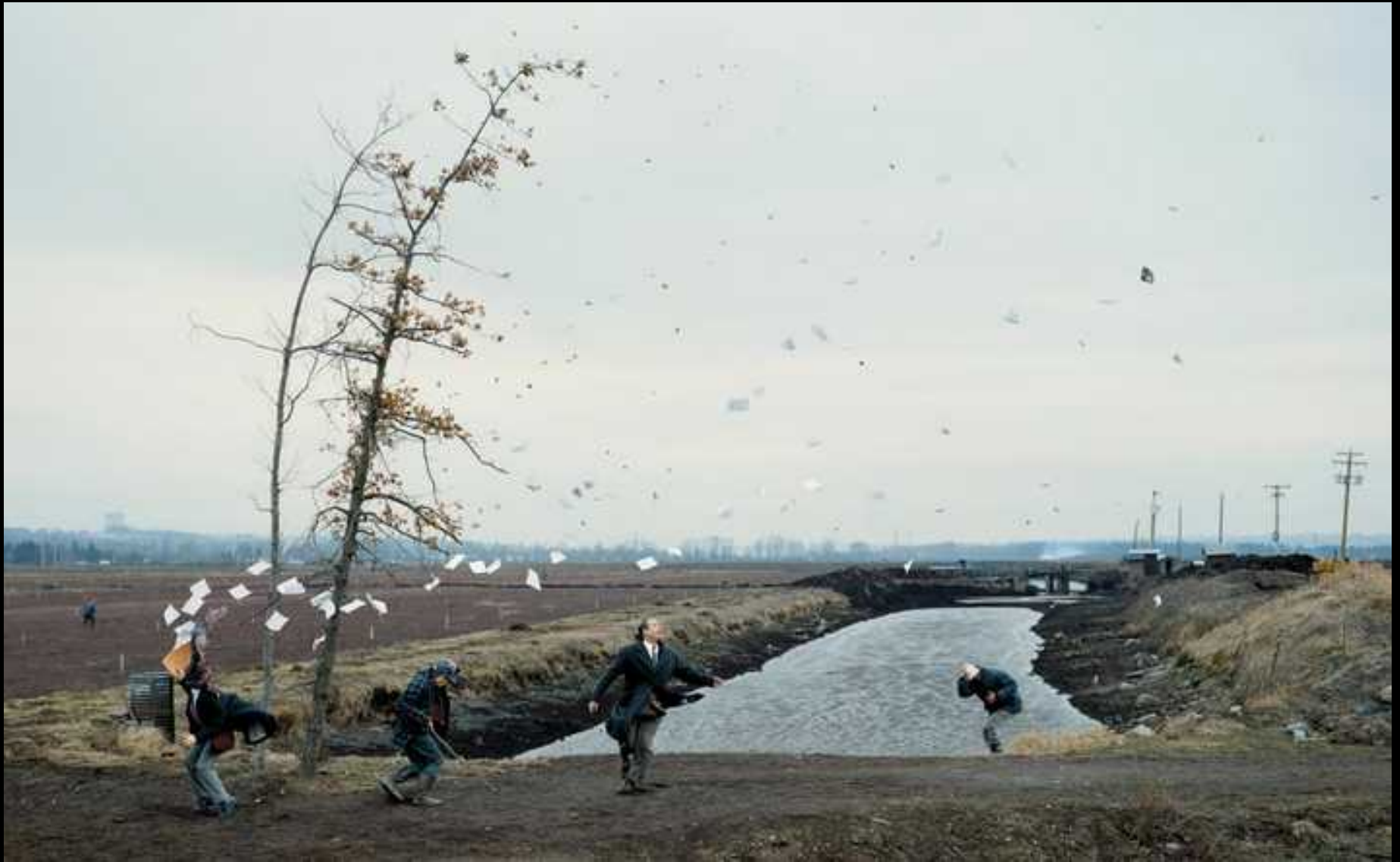
Photographie de Jeff Wall.