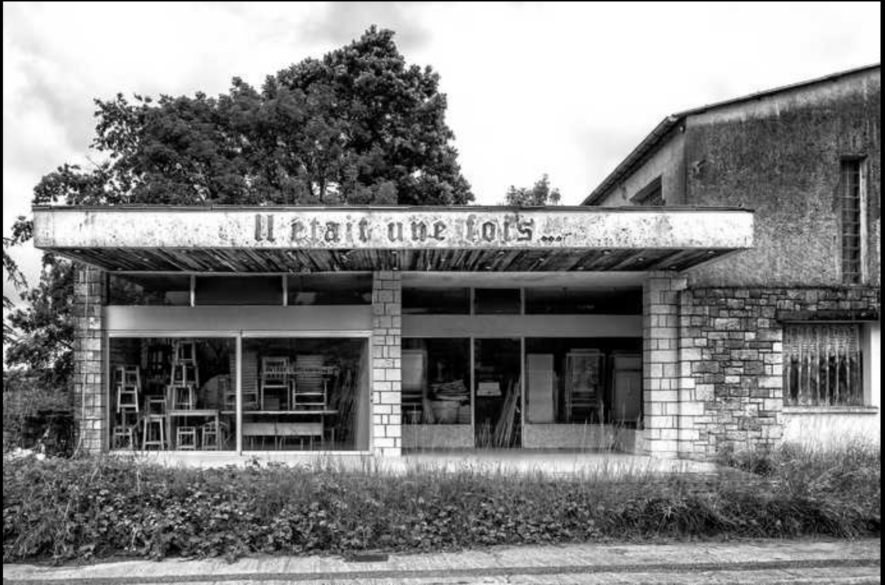
Devanture, centre de la France, juin 2021.