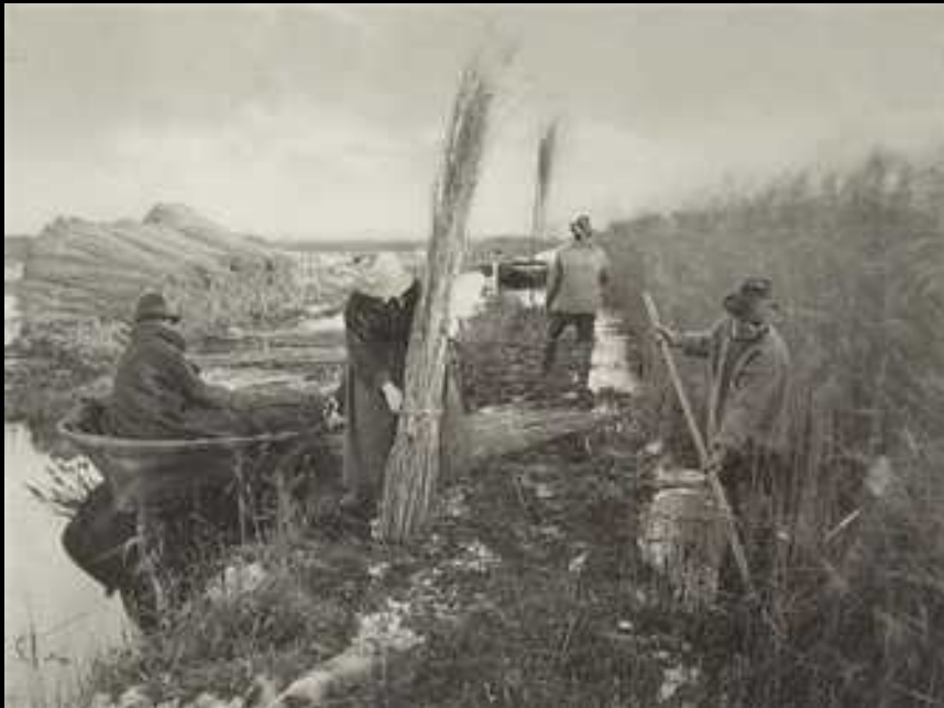
Peter Henry Emerson 1856 – 1936