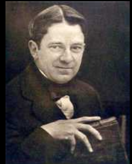
Alvin Langdon Coburn 1922