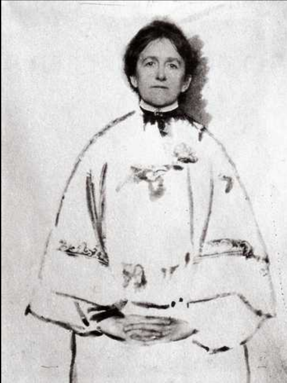
Auto-portrait de Gertrude Käsebier.