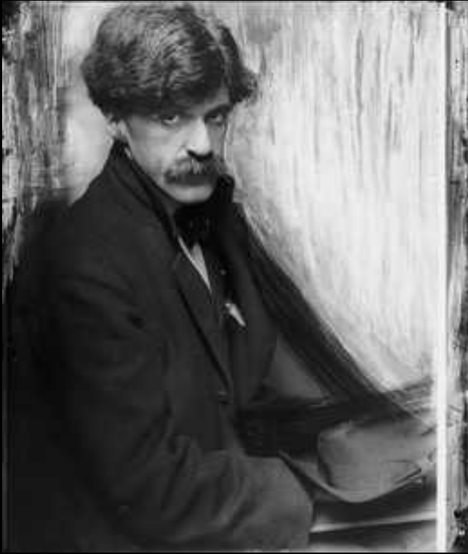
Alfred Stieglitz photographié par Gertrude Käsebier 1902 Fondateur de la revue camera work à NY