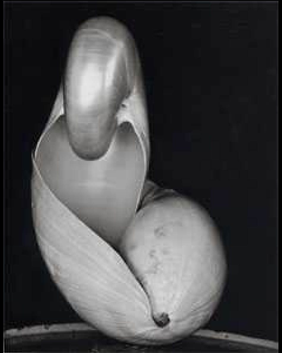
Edward Weston Shell 1927